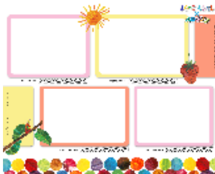
女の子用フォトフレーム例