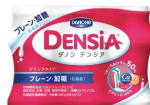
ドリンク(プレーン・加糖)