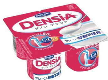
プレーン・砂糖不使用