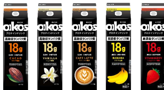
左から「カカオ風味」「バニラ風味」「カフェラテ風味」「バナナ風味」 「ストロベリー風味」