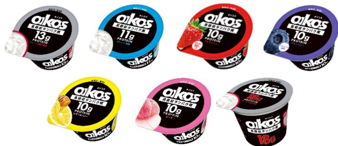
左上から「プレーン・砂糖不使用」「プレーン・加糖」「ストロベリー」「ブルーベリー」 左下から「レモン&ハニー」「ピーチ」「18g プレーン・砂糖不使用」