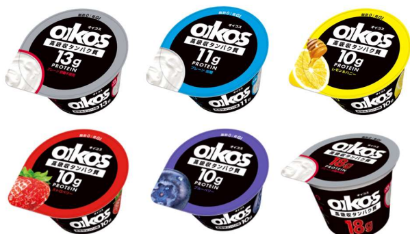
左上から「プレーン・砂糖不使用」「プレーン・加糖」「レモン&ハニー」 左下から「ストロベリー」「ブルーベリー」「18g プレーン・砂糖不使用」