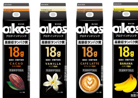
左から「カカオ風味」「バニラ風味」「カフェラテ風味」「バナナ風味」