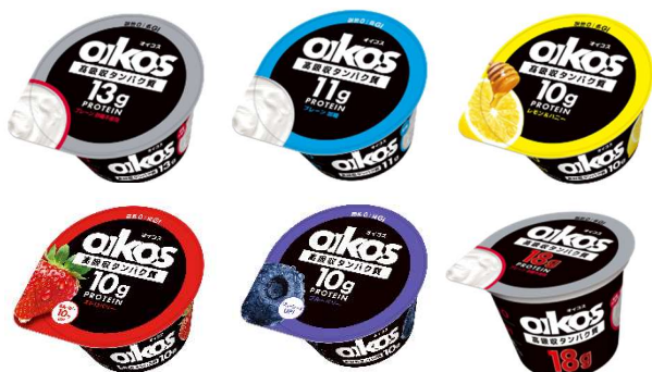
左上から「プレーン・砂糖不使用」「プレーン・加糖」「レモン&ハニー」 左下から「ストロベリー」「ブルーベリー」「18g プレーン・砂糖不使用」