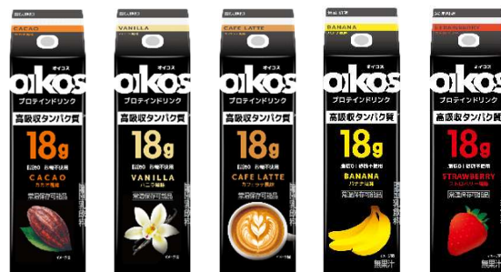
左から「カカオ風味」「バニラ風味」「カフェラテ風味」「バナナ風味」 「ストロベリー風味」